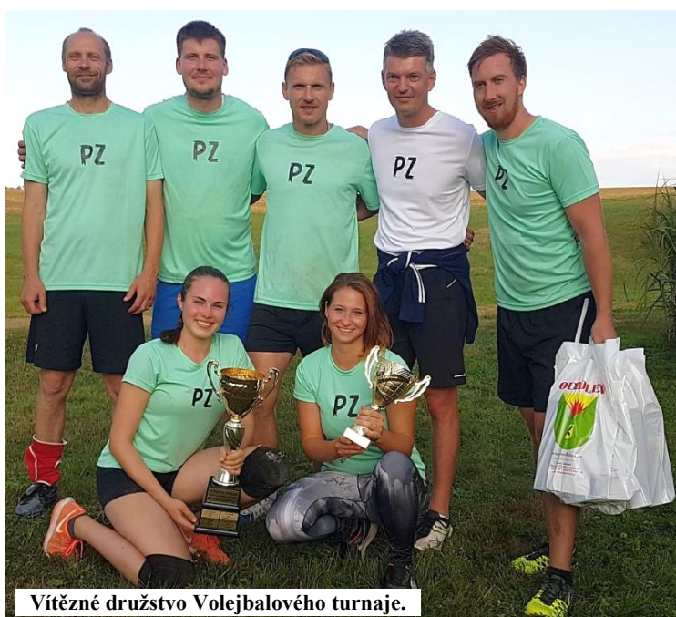
Vítězné družstvo Volejbalového turnaje.

Nutná je podložka pro cvičení a teplejší oblečení pro závěrečnou relaxaci. Těší se Líba